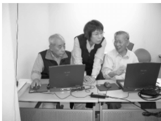
「学び合う」をモットーにした講習会風景