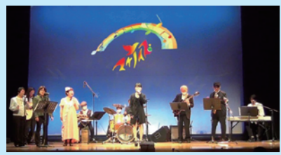
視聴者の応援で演奏活動にも力が入ります

高齢者施設などで演奏するとき、最初は静かに聞いているみなさんが途中から手拍子を始めたたり、一緒に歌ってくれたりするのを見ると嬉しくなるとのこと。コロナが明けてからは地域のイベントやお祭りなどに招待されて演奏するなど、活動を広げています。