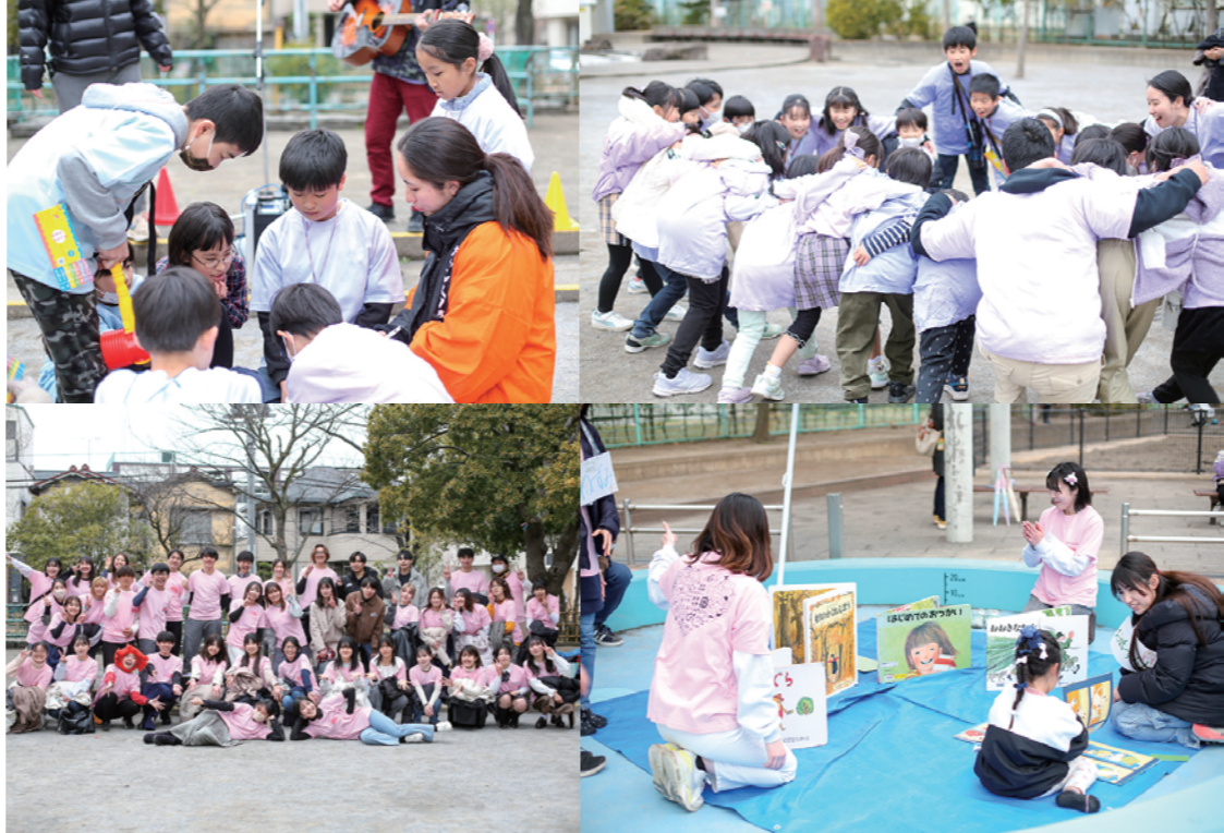
梅田亀田公園で開催したみんなの文化祭

月に1回、「ポッチャ※」や「ゴールボール」などの体験会を開催しており、3月のポッチャ体験会では30名ほどの子どもたちが参加しました。また、月に2回ほどNPO活動支援センターで開催しているポッチャ練習会は、少人数ですがじっくりポッチャを楽しむことができる機会となっています。※皮製ボールを投げ、白い目標球に